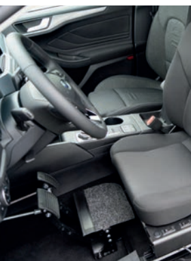
Pedalverlängerung & Fußraumerhöhung